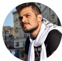
Davide Fagnani Comunicazione e Social media Redazione Rivista «AIASMAG»

dfagnani@networkaias.it cell. 346.1176583